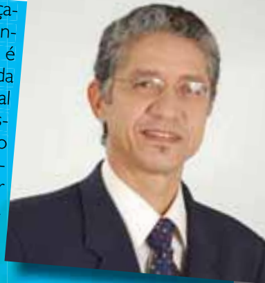
Cido Sérgio Prefeito de Araçatuba

O carnaval de Araçatuba vem se superando a cada ano. Isso é parte do esforço da Secretaria Municipal de Cultura, que desde o início de nosso governo está empenhada em organizar as escolas de samba da cidade. Considere o carnaval uma importante festa popular, pois aproxima pessoas de diferentes costumes, etnias e perfis sócio-econômicos. Outro lado que observo é que as atividades do carnaval movimentam trabalhadores muitos meses antes do desfiles. São costureiras, artesãos, serralheiros e tantos outros, que, se fossem profissionalizados e organizados em cooperativas, poderiam encontrar neste ofício uma excelente forma de geração de renda. Vamos trabalhar juntos para que isso ocorra.