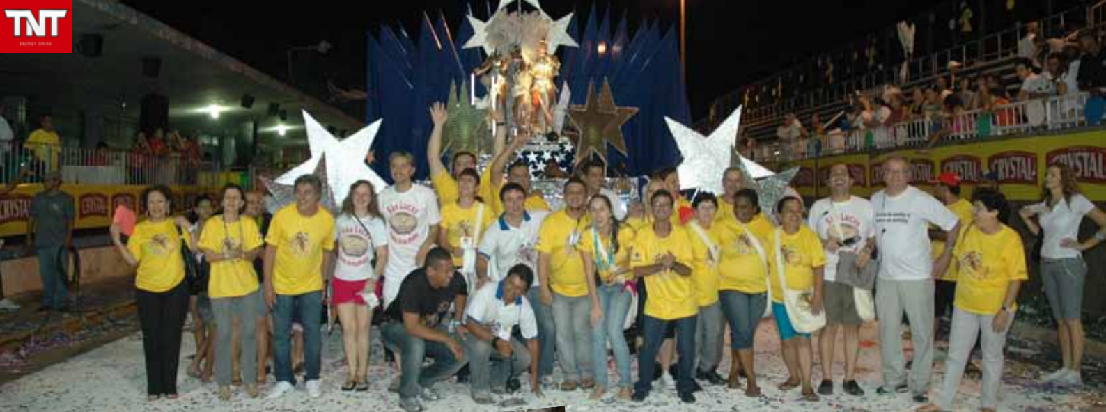
Equipe organizadora do Carna-Copa2010 Prefeitura, Secretaria da Cultura e ASSESA