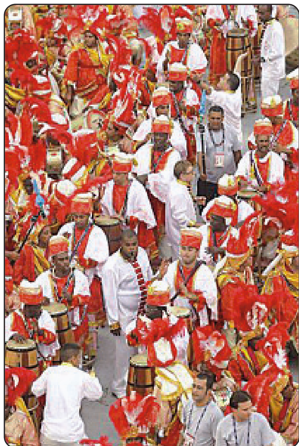
Unidos do Viradouro

Neste sábado, Viradouro e Cubango serão as escolas de samba que representarão Niterói na Avenida Marquês de Sapucaí pelo Grupo de Acesso, a ser transmitido pelo canal de TV aberta SBT. Elas mostrarão no sambódromo carioca todo o resultado de um ano inteiro de preparações para realizar um belo desfile e conseguir ascender ao desejado Grupo Especial.