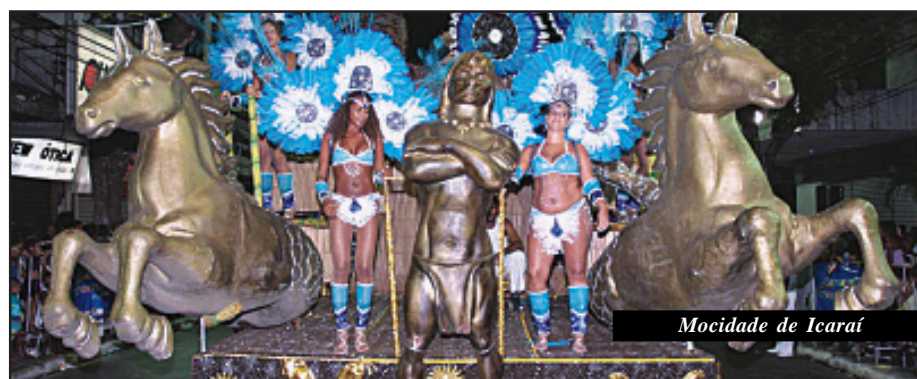
Mocidade de Icaraí

A Rua da Conceição, no Centro, será mais uma vez o palco da grande festa carnavalesca de Niterói. A arena de desfiles terá 500 metros (da Rua Visconde do Rio Branco até a Rua Luiz Leopoldo F. Pinheiro) e vai ganhar arquibancadas, sistema de iluminação especial e 30 banheiros químicos. A via é palco do Desfile Oficial da cidade desde meados da década de 80, após três décadas e meia sendo realizado na Av. Amarel Peixoto – local prometido para retorno da festa em 2013, por solicitação da União das Escolas de Samba e Blocos Carnavalescos de Niterói.