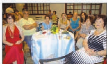
A comitiva da 3ª Região