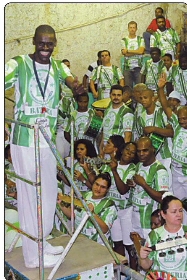
Acadêmicos do Cubango

Irineu Evangelista de Souza, o Barão de Mauá, foi um brilhante industrial, banqueiro, político e diplomata que edificou os estaleiros da Companhia Ponta da Areia e construiu, no ano de 1846, a indústria náutica brasileira, que se estabeleceu em Niterói. Em visita à cidade, o ex-presidente Lula elegeu o enredo da escola do bairro Cubango “o melhor de todo o carnaval brasileiro deste ano”. A agremiação contará com o ator Paulo Betti interpretando o Barão.