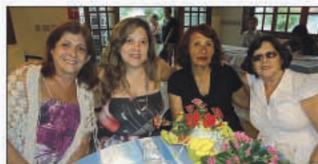
Professoras de Paraíba do Sul