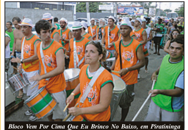
Bloco Vem Por Cima Que Eu Brinco No Baixo, em Piratininga