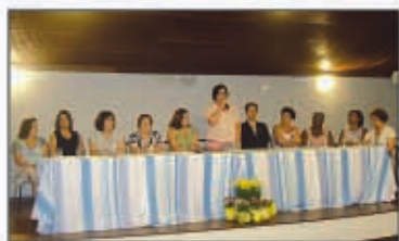
A presidente da Uppes chama a categoria à união

Haverá ainda a interdição do tráfego de veículos na Rua da Conceição, entre a Av. Visconde do Rio Branco e a Rua Luiz Leopoldo Fernandes Pinheiro, das 22h do dia 17 à 1h do dia 22; na Rua José Clemente, entre a Av. Visconde do Rio Branco e a Rua Almirante Teffé, das 22h do dia 17 à 1h do dia 22 na Trav. Acadêmico Walter Gonçalves, das 18h do dia 17 à 1h do dia 22; e de uma faixa de rolamento da Av. Visconde do Rio Branco, lado direito de circulação de veículos, no trecho entre a R. Aurelino Leal e a Av. Amarel Peixoto, sentido Ponta D'Areia, das 22h do dia 17 à 1h do dia 22.