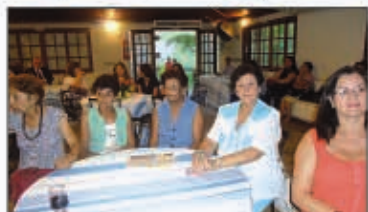
Campus bem representado