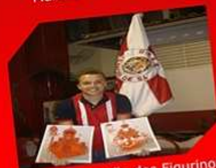
Apresentação dos Figurinos para o Carnaval 2011