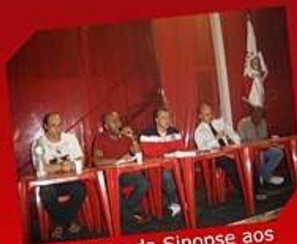
Entrega da Sinopse aos compositores