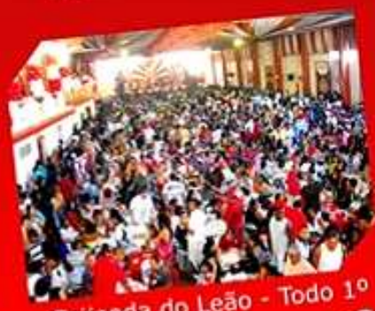
Feijoada do Leão - Todo 1º domingo do mês