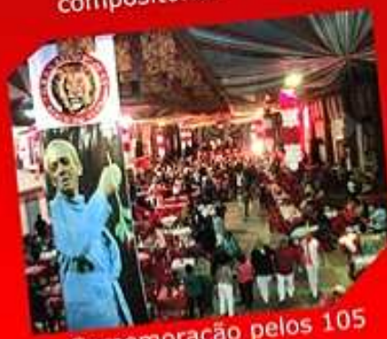
Comemoração pelos 105 anos de Ismael Silva