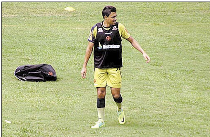
O atacante vascaíno treinou sozinho no estádio São Januário, na tarde de ontem

Quem também fez um trabalho de recuperação foi o volante Allan. Com estiramento na coxa esquerda, o jogador fez um trabalho na piscina do clube. A previsão é que ele volte aos gramados em