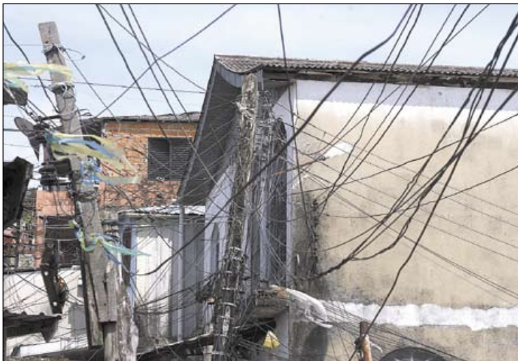
A Amazonas Energia informou que realiza fiscalizações para combater os "gatos"