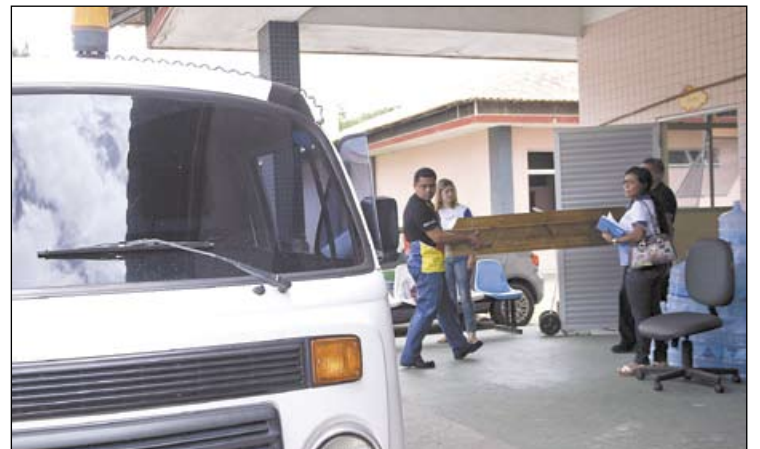
A menina morreu na manhã de ontem, no setor de emergência do pronto-socorro