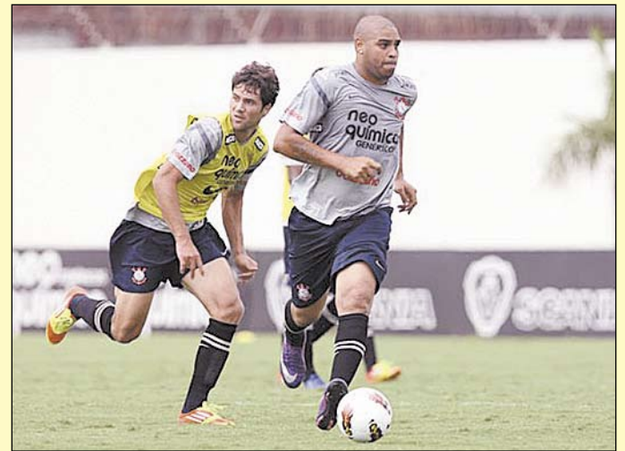
Imperador perdeu peso e está próximo de voltar a jogar como titular

rador permaneceu no campo e fez um novo trabalho, desta vez, de finalização. Seu desempenho foi bom, apesar da empolgação dos goleiros reservas em tentar pará-lo. Mais tarde, Adriano fará um novo trei-