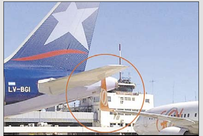
Choque entre as duas aeronaves ocorreu no aeroporto argentino, Aeroparque

em uma área além da delimitada para o "pushback", o que teria ocasionado o incidente.