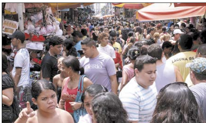
As lojas do Centro abrirão normalmente na segunda e na terça-feira ficarão fechadas

as lojas vão abrir das 14h às 21h na terça-feira, enquanto a praça de alimentação e o cinema serão das 12h às 22h. Na Quarta de Cinzas, as lojas abrem das 12h às 22h, sendo que a praça e o cinema funcionam das 12h às 23h. As lojas do Millennium Shopping abrirão de 14h às 20h e as praças de alimentação funcionarão das 11h às 22h, na terça. Na quarta, o expediente será após as 12h.