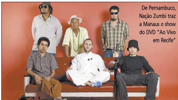
De Pernambuco, Nação Zumbi traz a Manaus o show do DVD "Ao Vivo em Recife"

No dia 21, as bandas Tucumanus, Caixakústica e Essence realizarão os shows de abertura do evento, no Teatro Amazonas. Outras 25 bandas locais farão apresentações nos dias seguintes, no largo Mestre Chico.