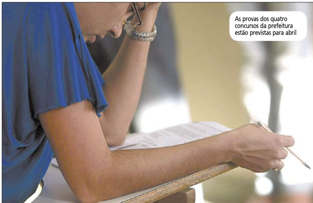
As provas dos quatro concursos da prefeitura estão previstas para abril

As taxas de inscrições são de R$ 65 para os cargos de nível médio, R$ 75 para nível superior e R$ 100 para o cargo de Procurador Autárquico. Mais informações disponíveis no site do Cetro Concursos, http://www.cetroconcursos.org.br .