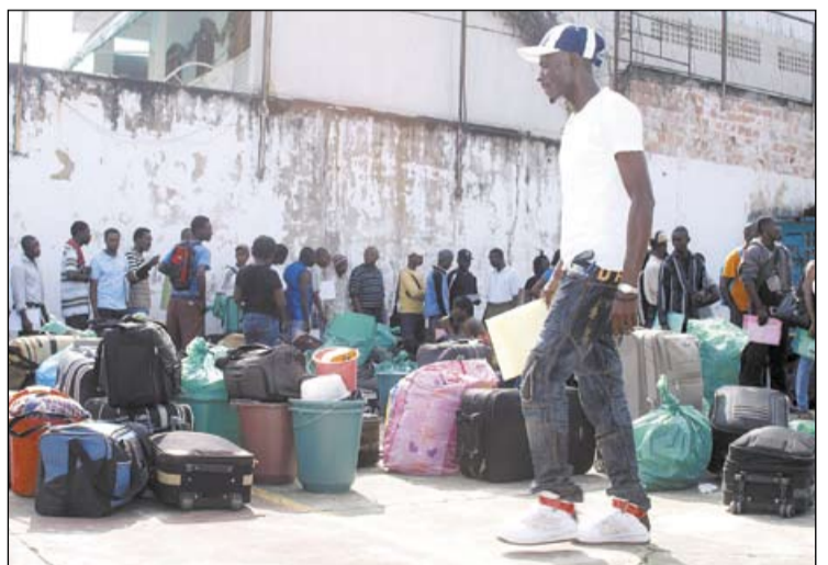
Ação será destinada ao atendimento médico e laboratorial dos haitianos em Manaus

retora técnica, além dos exames laboratoriais, serão aplicadas vacinas contra hepatite B, febre amarela e tétano, bem como verificação de doenças de peles e acompanhamentos de haitianos com estado febril e quadro de diarreia.