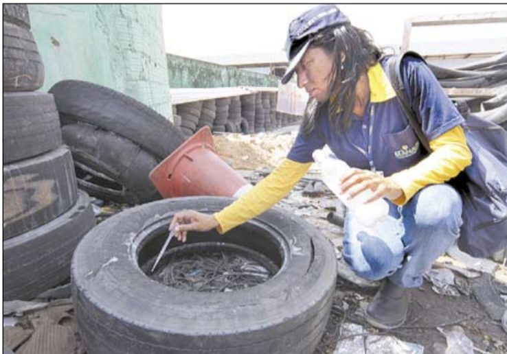
Agentes de operação eliminaram 266,7 mil depósitos de larvas