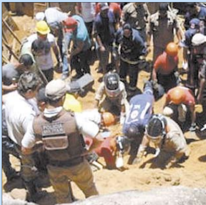
Prédio em construção desabou em Vitória da Conquista, na Bahia

A Defesa Civil esteve no terreno para avaliar a situação e o terreno. A área do acidente passará por perícia para determinar a causa do desabamento.