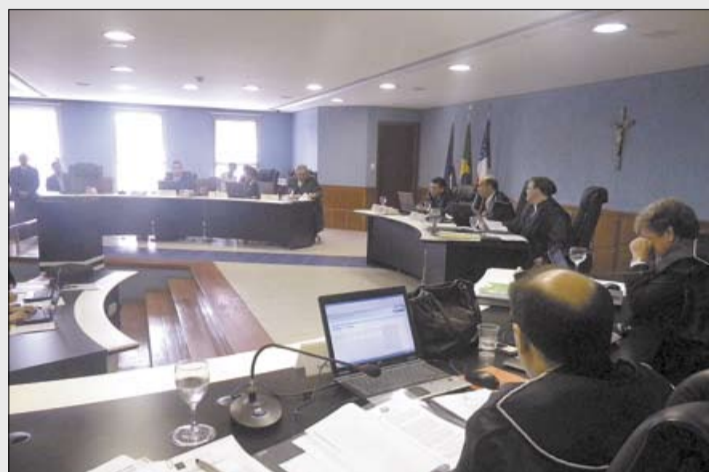
Conselheiros do tribunal multaram prefeitos durante a sessão de ontem (9)