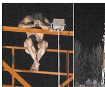
Homem ficou nu em torre de 70 metros

Negociadores da polícia conseguiram convencê-lo a descer até uma plataforma mais baixa. Depois, ele foi enrolado em uma toalha e desceu com a ajuda de um sistema improvisado de polias feito pelos bombeiros.