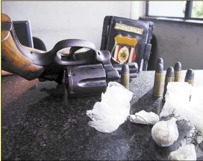
A polícia apreendeu um revólver calibre 38 e seis trouxinhas de entorpecente

Os policiais também encontraram, com os suspeitos, 6 trouxinhas de pasta-base de cocaína. As vítimas levaram tiros nas pernas e estão em observação no Pronto-Socorro 28 de Agosto. De acordo com o chefe de inves-