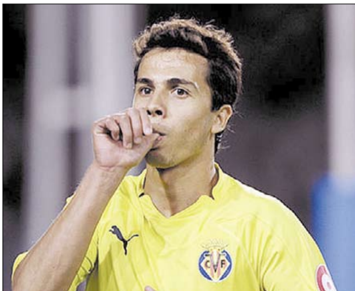
Nilmar pode deixar o Villarreal a qualquer momento e ir para o Tricolor