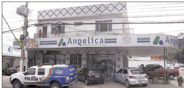
PMs perceberam atitude suspeita, invadiram a drogaria e prenderam os acusados

Policiais da 16ª Companhia Interativa Comunitária (Cicom), que passavam pelo local perceberam a movimentação suspeita e decidiram entrar e surpreender os acusados. Depois de uma negociação conseguiram desarmar e prender os suspeitos, que tinham feitos reféns as vítimas.