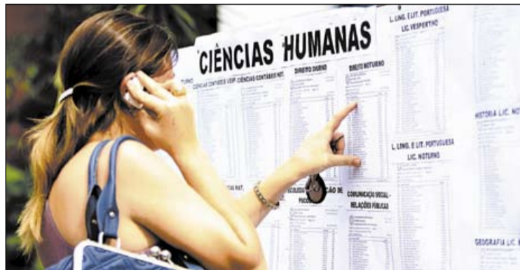
O cadastro estudantil não assegura matrícula, sendo necessária entrega da documentação