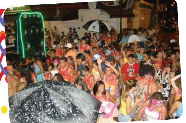
Turma da Bika/Comitiva Trem Q' Pula