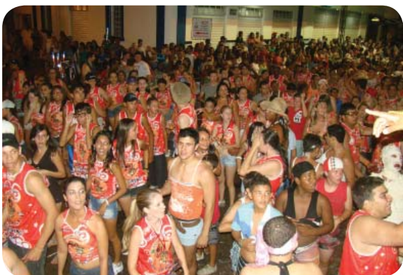
Os Vira Latas