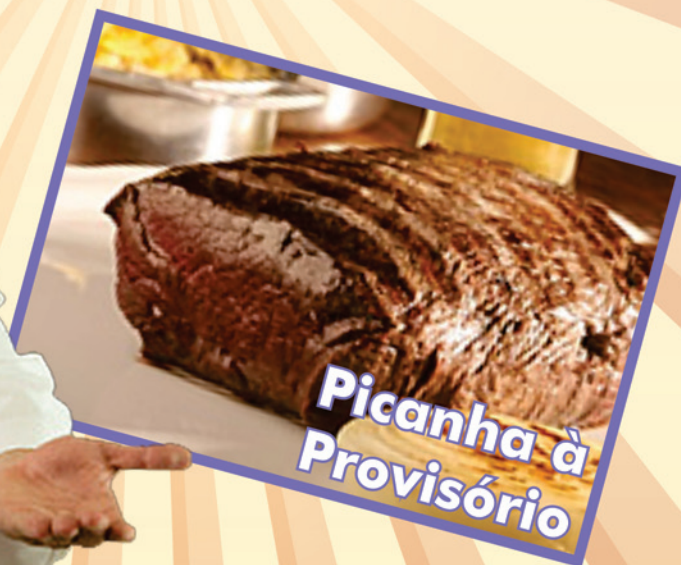
Picanha à Provisório