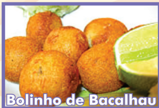
Bolinho de Bacalhau