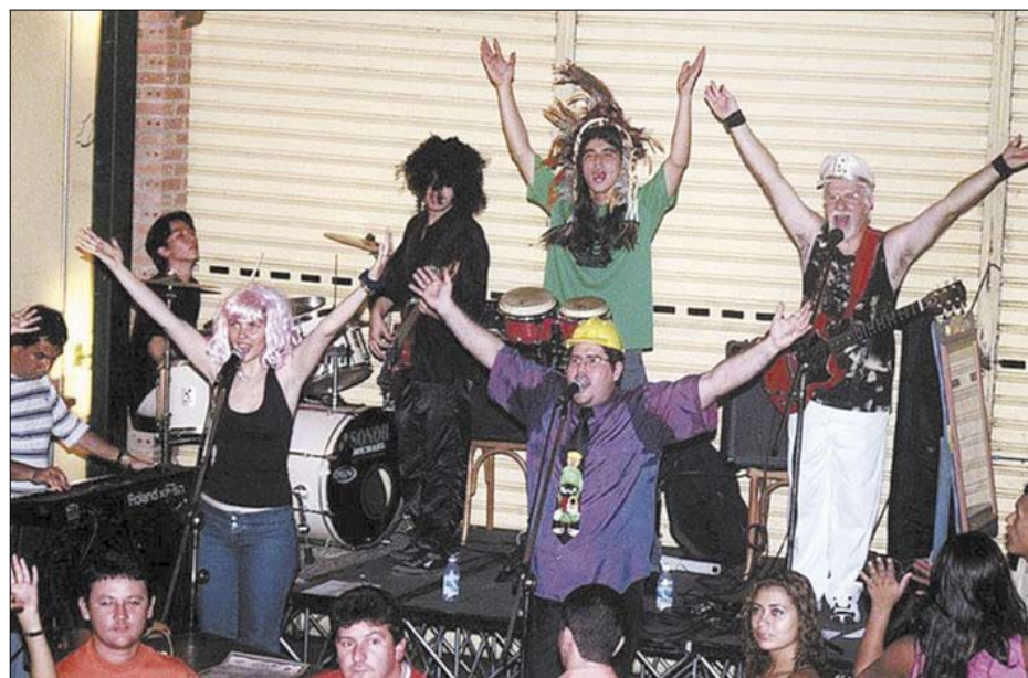
Além do set list dançante, a banda ficou conhecida pelo figurino e performance