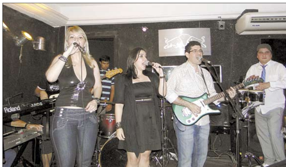
A Overtime começou a tocar nos palcos e festas de Manaus em 2000