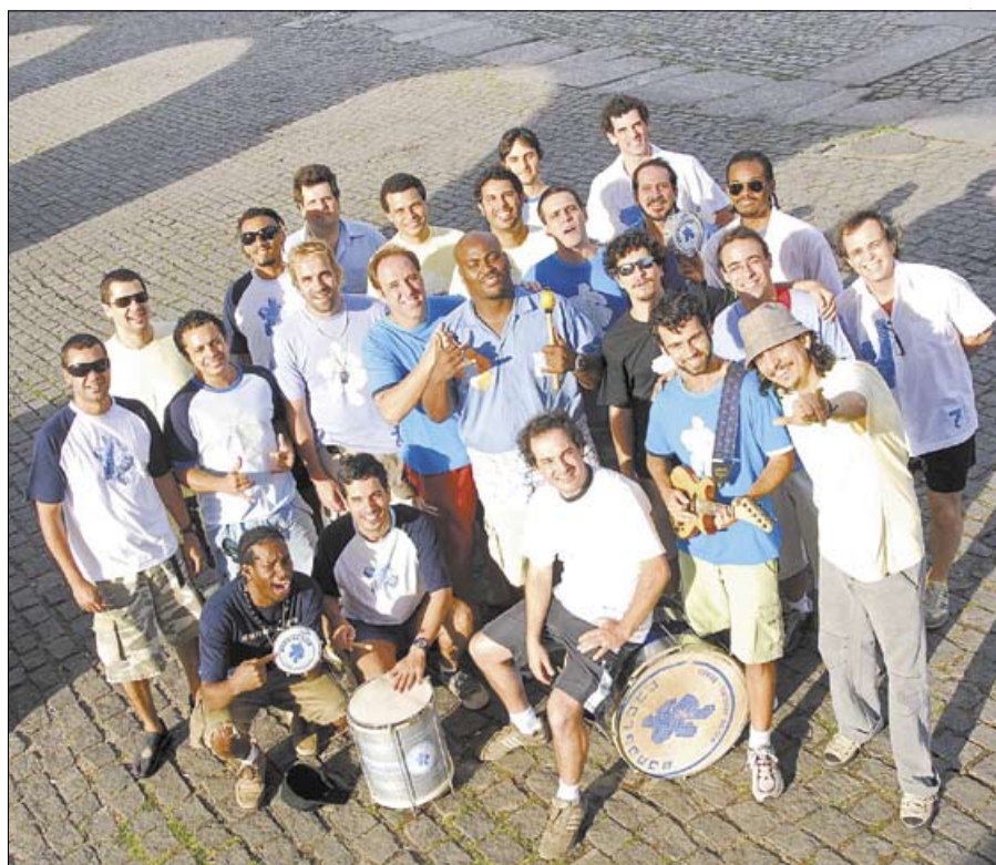
A banda Monobloco é uma das atrações confirmadas para Manaus