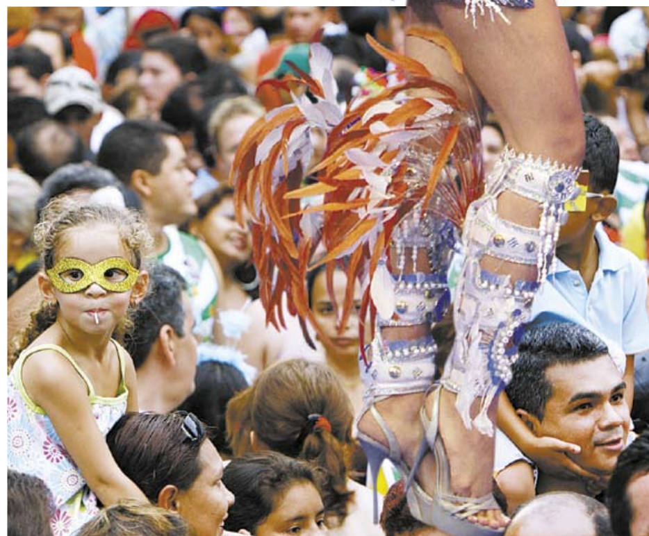
A partir deste fim de semana, o manauense têm opções de festa de Carnaval

Também tradicional no período carnavalesco, o “Bloco das Piranhas”, já tem data marcada, dia 19 de fevereiro, mas o local e os valores de ingresso também não foram divulgados.