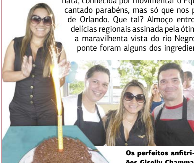
A festejada aniversariante