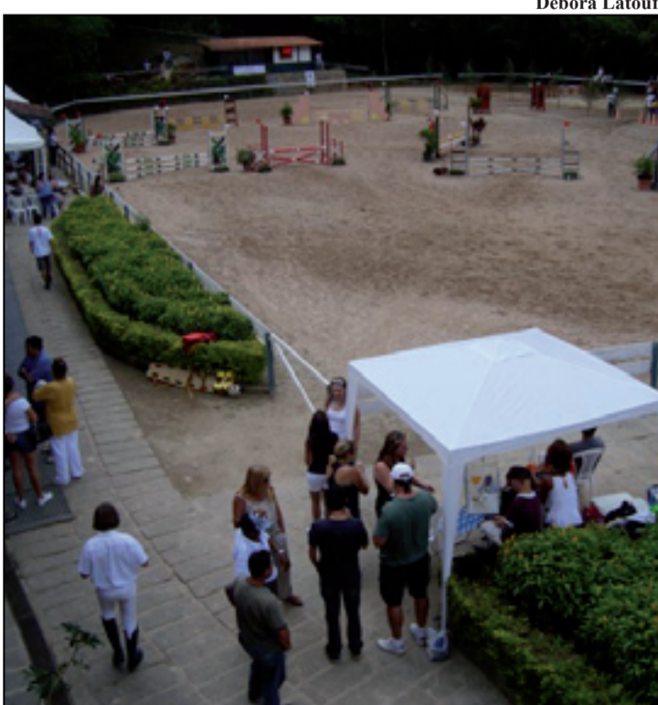
O GP Manège Sportiello, marca a abertura oficial da temporada de saltos na Região Serrana. As provas serão realizadas dia 25

Vale à pena conferir, pois o espetáculo é emocionante.