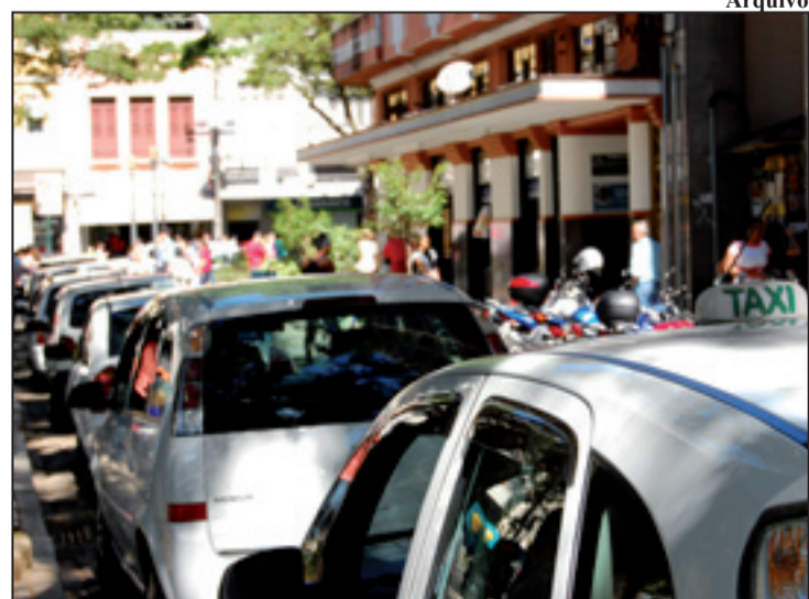
Taxistas são contrários ao projeto de lei que está em tramitação