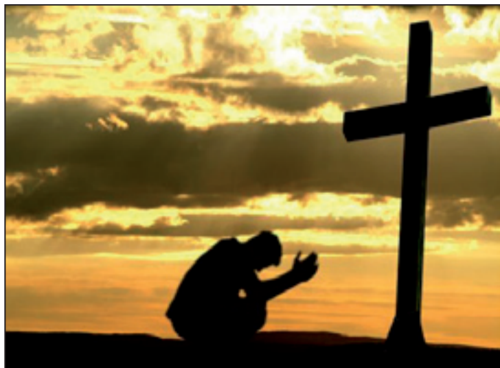
Um tempo reservado à reflexão, até abril e a Páscoa

Aos cristãos, portanto, pede-se que intensifiquem a prática dos princípios básicos