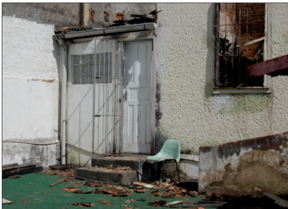
Unidade ficou completamente destruída. Material escolar, roupas e mantimentos foram perdidos

Por enquanto, a instituição - que não tem fins lucrativos e fica na Travessa Cristina - irá funcionar na casa da diretora pedagógica, Deise Machado, próximo dali. São cerca de 20 alunos - do berçário à educação infantil - atendidos e outros 15 iriam entrar ainda este mês. Obras deverão ser realizadas para tentar voltar ao funcionamento normal da instituição. A Defesa Civil esteve no local e alguns trechos da casa não poderão ser usados antes do término das obras. A instituição funciona há cerca de