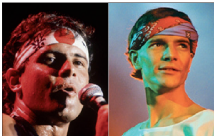
Cazuzza (dir.) e Daniel de Oliveira (dir.), ator que o interpreta no filme

O filme traz uma reprodução da vida louca que marcou o percurso profissional e pessoal de Cazuzza, do início da carreira, em 1981, junto com o Barão Vermelho, até a morte em 1990, aos 32 anos: o sucesso com o grupo, a carreira solo, as músicas que falavam dos anseios de uma geração, o comportamento transgressor e a coragem de continuar a carreira, criando e se apresentando, mesmo debilitado pela Aids.