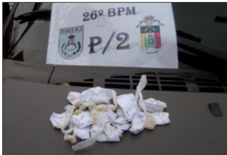
A droga estava com um homem de 31 anos no Sgt. Boening

A diretora ainda lembrou que, agora, a instituição vai precisar de ajuda com doações. Eles precisam, principalmente, de material escolar e também para reconstruir a creche. Quem puder ajudar pode entrar em contato com a escola através do número de celular 88083591.