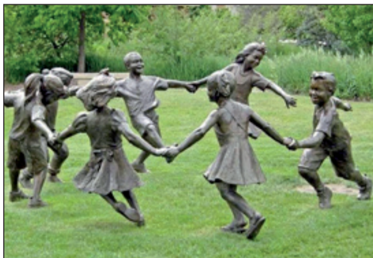
Uma ciranda especial, voltada para todas as idades

Para se inscrever, os documentos necessários são uma foto 3 X 4, xerox da cer-