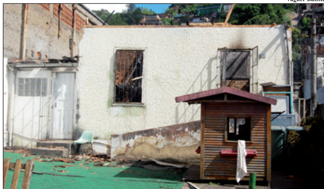
O fogo destruiu todo material escolar das crianças, roupas, sapatos e outros equipamentos da creche