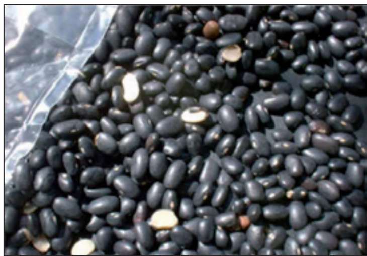
Segundo pesquisa, o preço do produto oscilou nos mercados

O preço do arroz Tio João 5 kg sofreu apenas uma variação no Supermercado Extra, passando de R$ 9,45 para R$ 10,59. O feijão Combrasil 1 kg teve uma alta considerável. No Extra e Celma o produto subiu 10% e 4% respectivamente. O Café Pilão 500 g ficou mais caro 9,6% no Extra, chegando a custar nessa semana R$