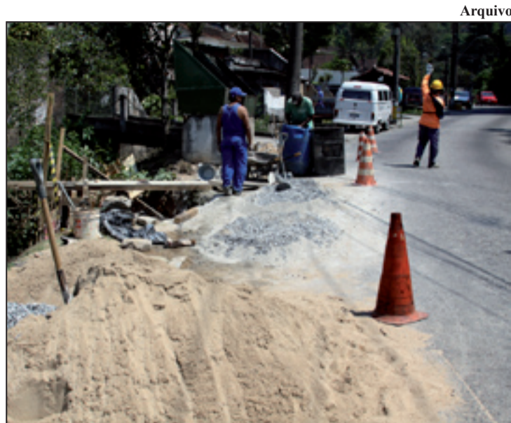
Nas obras as placas deverão ser informativa, segundo o projeto