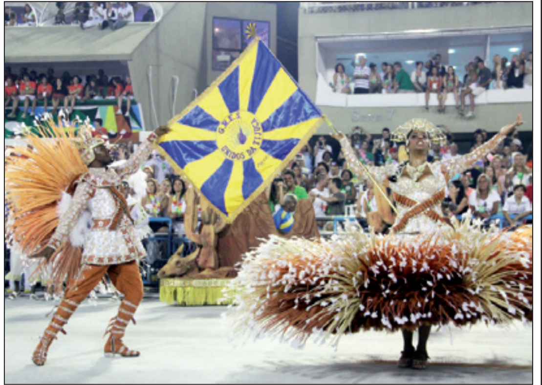
A Unidos da Tijuca foi a campeã do Carnaval no Rio de Janeiro homenageando Luiz Gonzaga