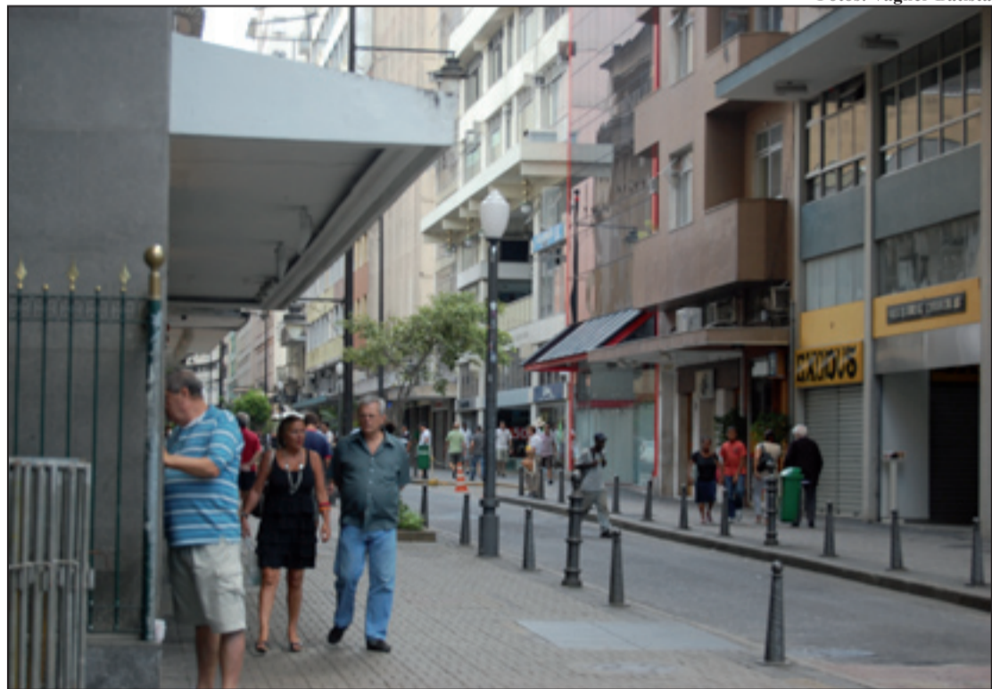
Na Rua 16 de Março poucas pessoas se aventuraram a andar pela via. Hoje o comércio reabre

Depois de quatro dias de intensa folia pela cidade, os petropolitanos não quiseram sair de suas casas na Quarta-Feira de Cinzas. As suas principais vias, como as Ruas do Imperador e 16 de Março tiveram pouco movimento, tendo a maioria de suas lojas fechadas o dia todo.