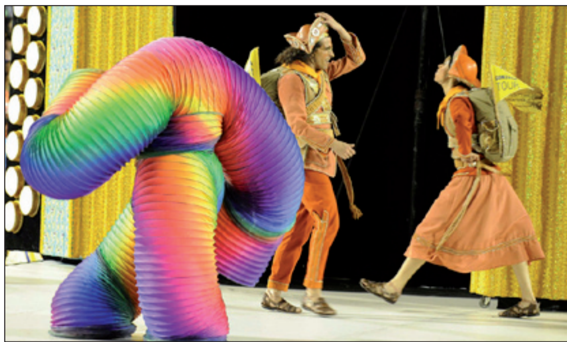
A comissão de frente da Unidos da Tijuca deu um verdadeiro show na Marques de Sapucaí

A Unidos da Tijuca foi eleita a campeã do Carnaval carioca nesta quarta-feira (22). A escola da Zona Norte é a vencedora pela terceira vez em sua história após uma acirrada disputa na apuração do Grupo Especial que aconteceu na Sapucaí. Porto da Pedra e Renascer de Jacarepaguá foram rebaixas para o Grupo de Acesso A. O desfile das campeãs, Unidos da Tijuca, Salgueiro, Vila Isabel, Beija-Flor e Grande Rio acontecerá no neste sábado (25)