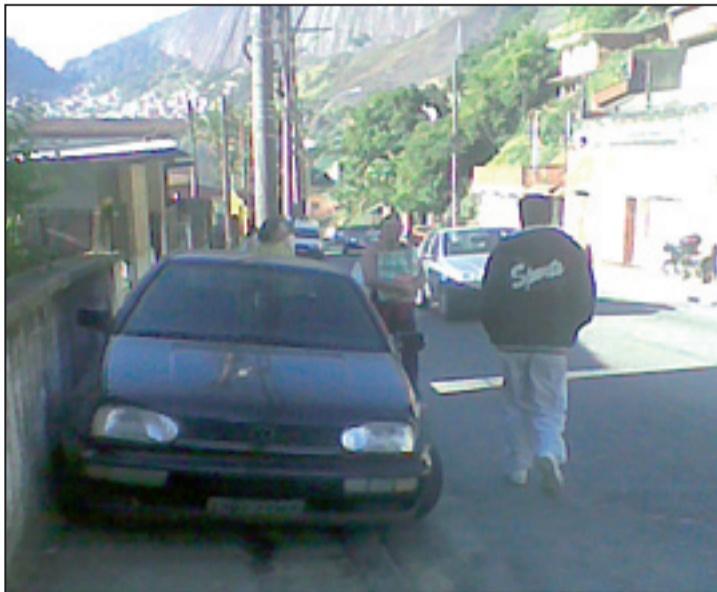
Parece ser eterno problema de estacionamento nas calçadas da Rua Quissamã

Ambos os moradores insistiram que as autoridades do transporte devam realizar blitz e multar quem estacionar sobre as calçadas. Eles ironizaram ao prever que o