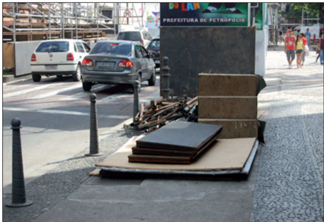
Após os desfiles foi iniciada a desmontagem dos palanques e arquibancadas na Rua do Imperador

Na manhã de ontem mesmo a Prefeitura já começou a desmontar as arquibancadas, que acolheram o público no desfile das escolas de samba petropolitanas na Rua do Imperador, e as 12 barracas que ficaram na Praça D. Pedro II. Foram vistos também agentes da Comdep que iniciaram a limpeza das ruas, retirando muito confete e latas de cerveja.