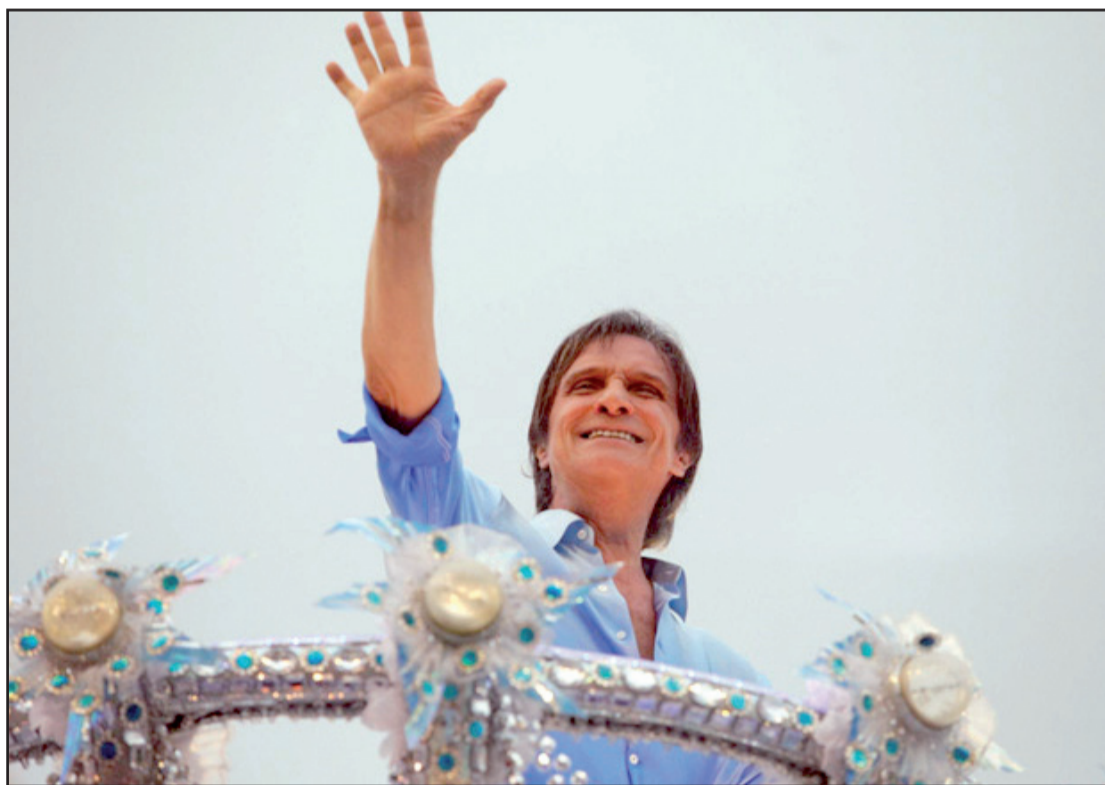
O cantor Roberto Carlos recebeu a homenagem da escola de samba da Baixada Fluminense

A Beija-Flor é a campeã do Carnaval carioca pela 12ª vez. Homenageando o Rei da Jovem Guarda, Roberto Carlos, a escola de Nilópolis, na Baixada Fluminense, ficou quase dois pontos à frente da vice-campeã, a Unidos da Tijuca que levou o título no ano passado. As cantoras que participaram do projeto "Elas cantam Roberto", como Hebe Camargo, Alcione, Fafá de Belém, Rosemary e Fernanda Abreu, desfilaram no quarto carro da Beija-Flor. Os amigos Erasmo Carlos e Wanderléia também fizeram questão de prestigiar o amigo. (Página 8)