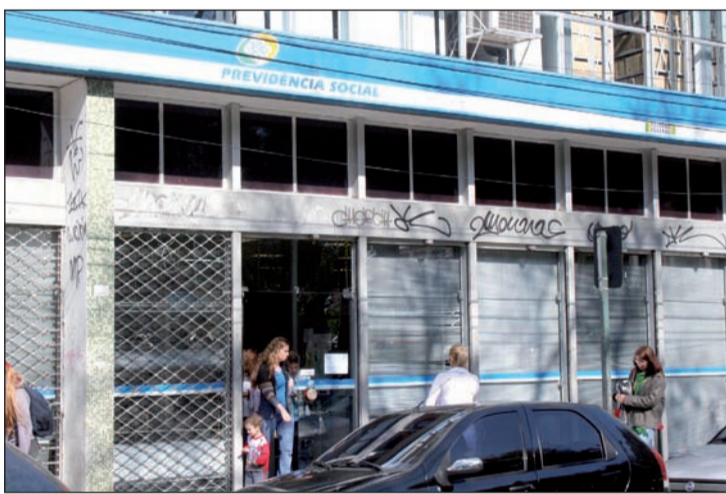
Aposentados e pensionistas podem entrar com ações contra o INSS

Ainda está sob análise da Advocacia-Geral da União (AGU) a elaboração do parecer técnico com as normas para o pagamento de