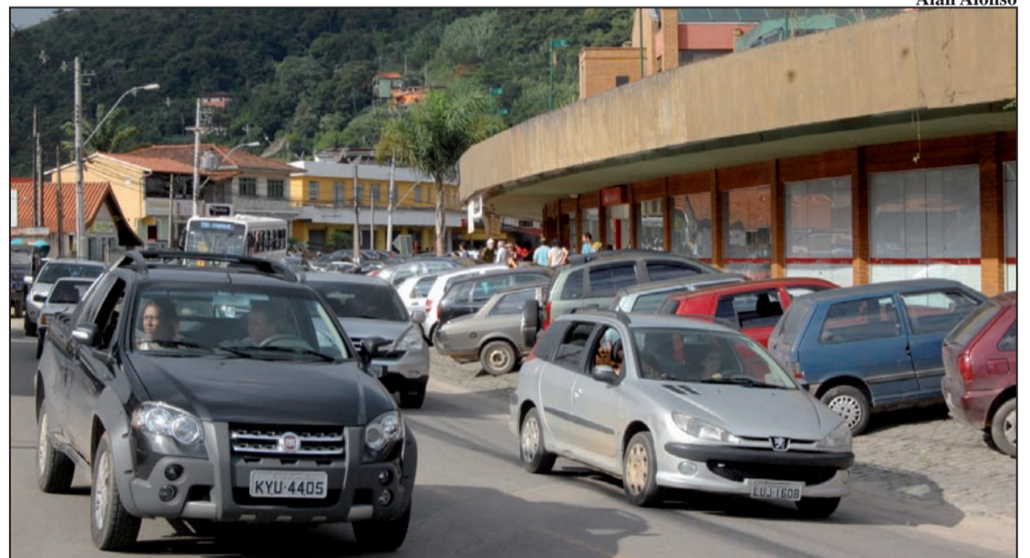
Turistas e consumidores movimentaram Itaipava durante o Carnaval: redução menor do que a esperada

O restaurante Adega dos Frades foi outro que sofreu du-