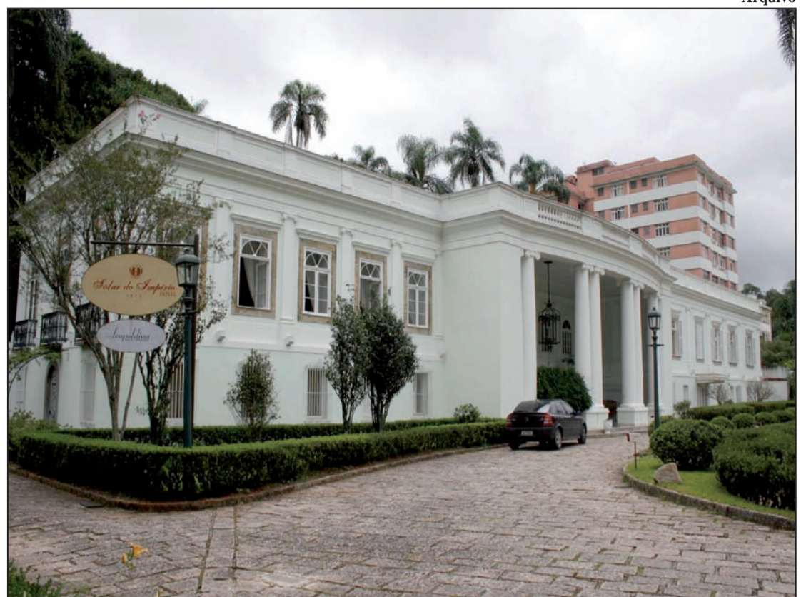
Solar do Império, no Centro: hotéis e pousadas tiveram ocupação de 90% no Carnaval de 2010, antes das chuvas

Perguntado sobre a possibilidade de a não realização do Carnaval ter contribuído para a recuperação