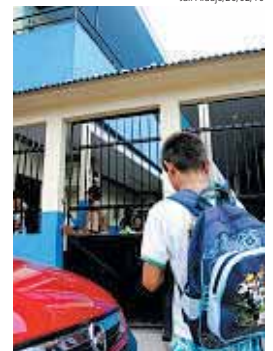
Atendimento em 286 escolas

Entre os dias 12 e 17 de janeiro os atendimentos serão para os alunos que farão transferência de escola. De 19 a 23 é a vez dos alunos que irão cursar os ensinos Fundamental e Médio. Do dia 24 ao dia 26 o atendimento é para os alunos novatos e de 27 a 31 será o atendimento de todas as modalidades para aqueles que perderam o prazo.