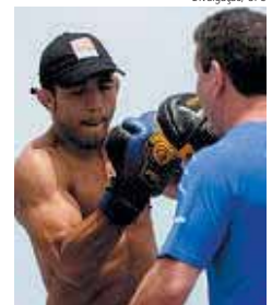
Preparação Manauara treinou na praia ontem

De acordo com o brasileiro, não existe a menor chance de deixar o octógono, na HSBC Arena, sem o título.