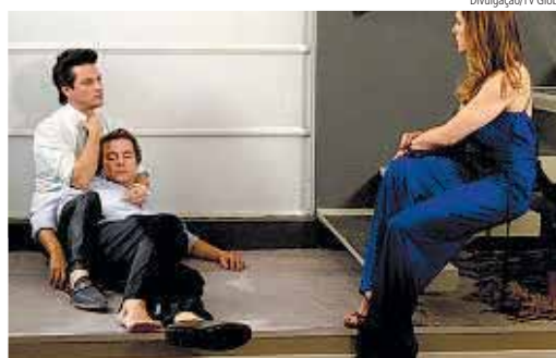
Morte Ele se desespera e pela primeira vez questiona a patroa

na Estampa' é uma obra de Aguinaldo Silva, com direção geral e de núcleo de Wolf Maya. Na direção, estão Ary Coslov, Claudio Boeckel, Mar-