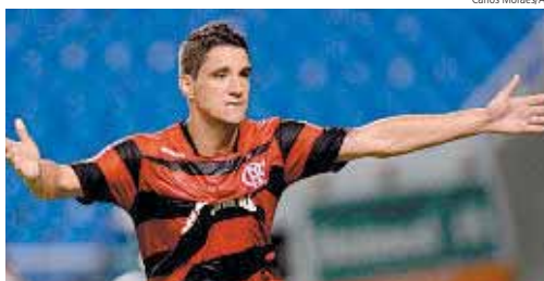
Situação Jogador disse que prefere ficar no Flamengo

Com o adiamento do acordo entre Flamengo e o clube árabe Al Hilal, o Fluminense aparece como forte candidato a contar com o meia Thiago Neves em seu elenco nesta temporada. O tricolor carioca já havia manifestado interesse na contratação do camisa 7 do Flamengo, mas não tinha oficializado nenhuma proposta.