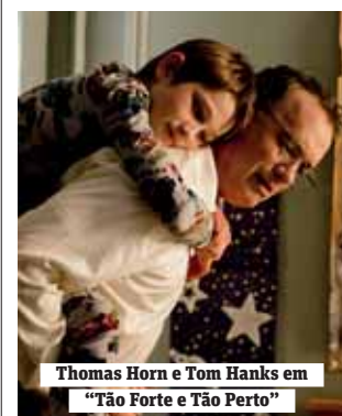
Thomas Horn e Tom Hanks em “Tão Forte e Tão Perto”

1 Britney Spears deve assumir uma das vagas de jurada de “The X Factor” deixadas por Nicole Scherzinger e Paula Abdul.