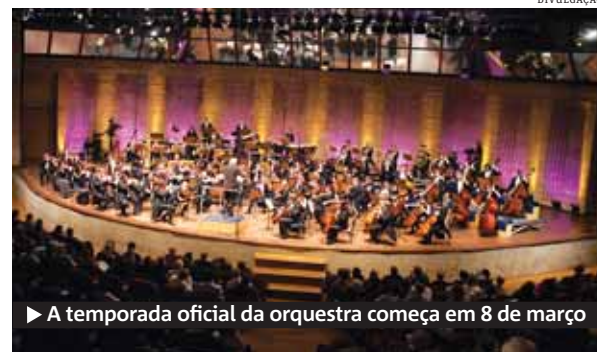
► A temporada oficial da orquestra começa em 8 de março