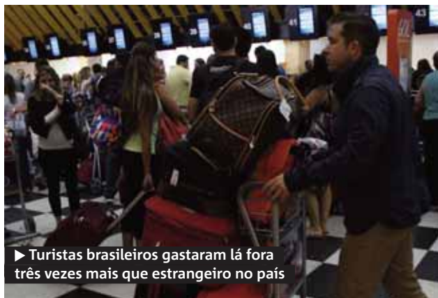
▶ Turistas brasileiros gastaram lá fora três vezes mais que estrangeiro no país

O valor do mês passado também é três vezes superior à despesa dos estrangeiros no país. Os gastos de viajantes estrangeiros no Brasil cresceram 10,1% em um