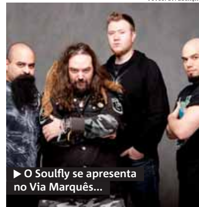
► O Soulfly se apresenta no Via Marquês...

Howler – No Beco 203 (r. Augusta, 609, Consolação, tel.: 2339-0358). Hoje. Abertura da casa: 22h. Show: meia-noite. R$ 70. Soulfly – No Via Marquês (av. Marquês de São Vicente, 1.589, Barra Funda, tel.: 3615-2060. Amanhã, a partir das 20h. De R$ 70 a R$ 200.