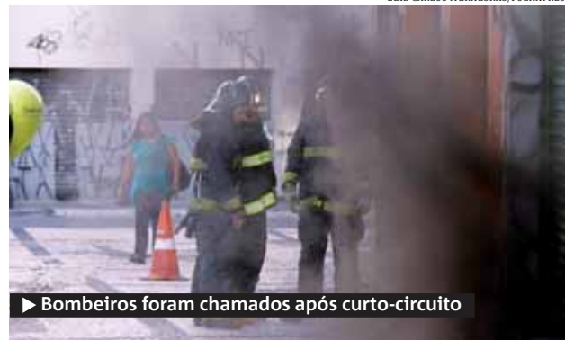
► Bombeiros foram chamados após curto-circuito