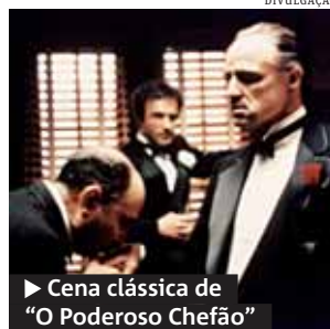
► Cena clássica de “O Poderoso Chefão”

“O Poderoso Chefão” abre o ciclo, às 15h30. Ama-