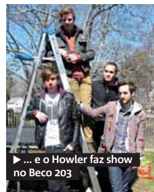
► ... e o Howler faz show no Beco 203