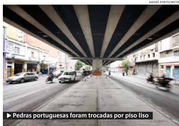
► Pedras portuguesas foram trocadas por piso liso