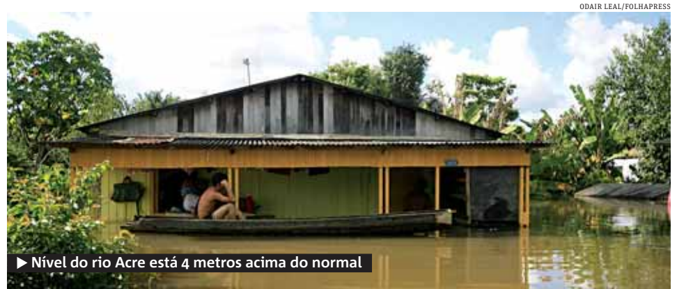
► Nível do rio Acre está 4 metros acima do normal

A PRF também apreendeu 703 kg de cocaína, 412 kg de maconha e 3 mil pedras de crack. ● METRO