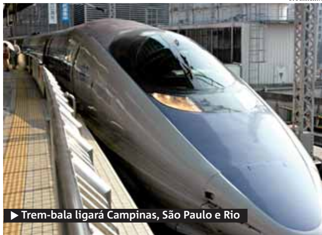
► Trem-bala ligará Campinas, São Paulo e Rio

Segundo o jornal "Valor Econômico", para garantir o interesse do setor privado, o governo assumirá o