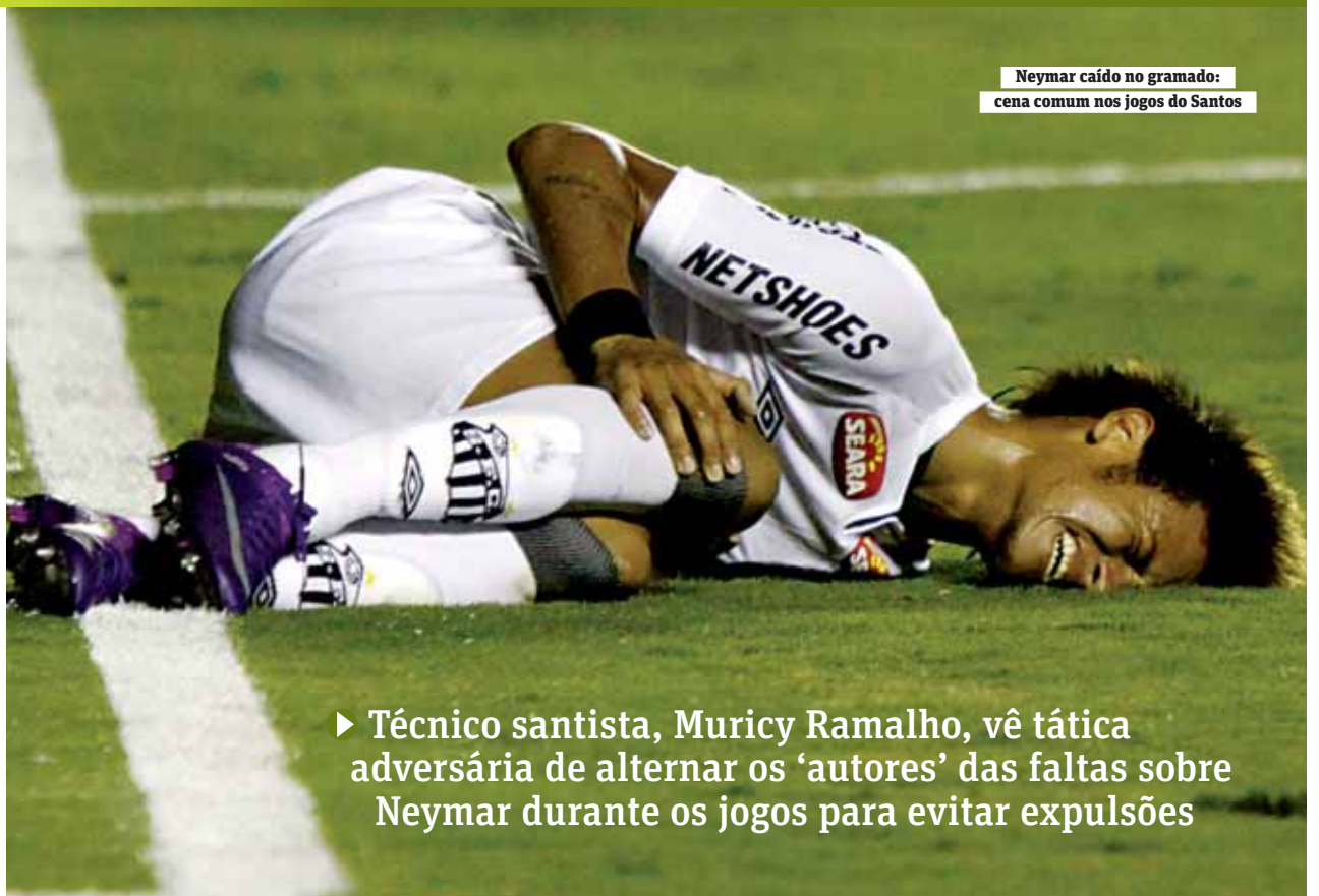
Neymar caído no gramado: cena comum nos jogos do Santos

“Eu não vendo nem faço imposição de nada, a gente se convence no dia a dia, com o trabalho, todos são valorizados nas vitórias”, lembrou. BAND.