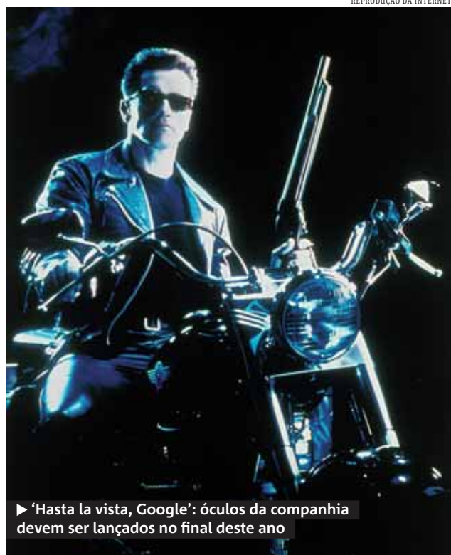
► 'Hasta la vista, Google': óculos da companhia devem ser lançados no final deste ano