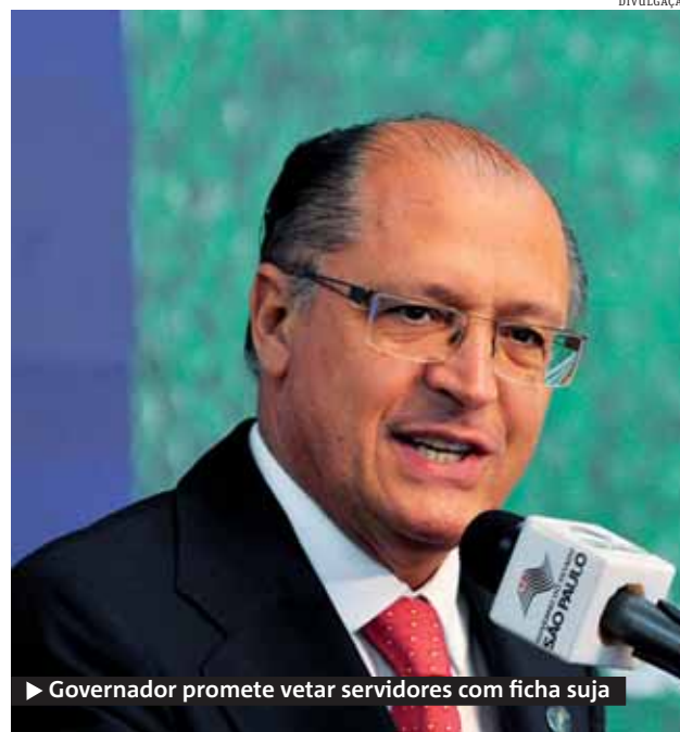
► Governador promete vetar servidores com ficha suja