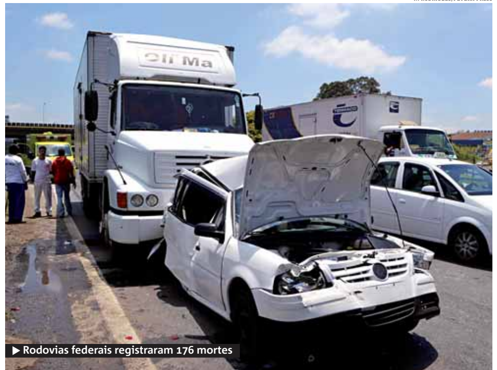
► Rodovias federais registraram 176 mortes