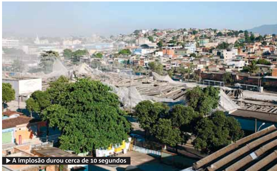
► A implosão durou cerca de 10 segundos