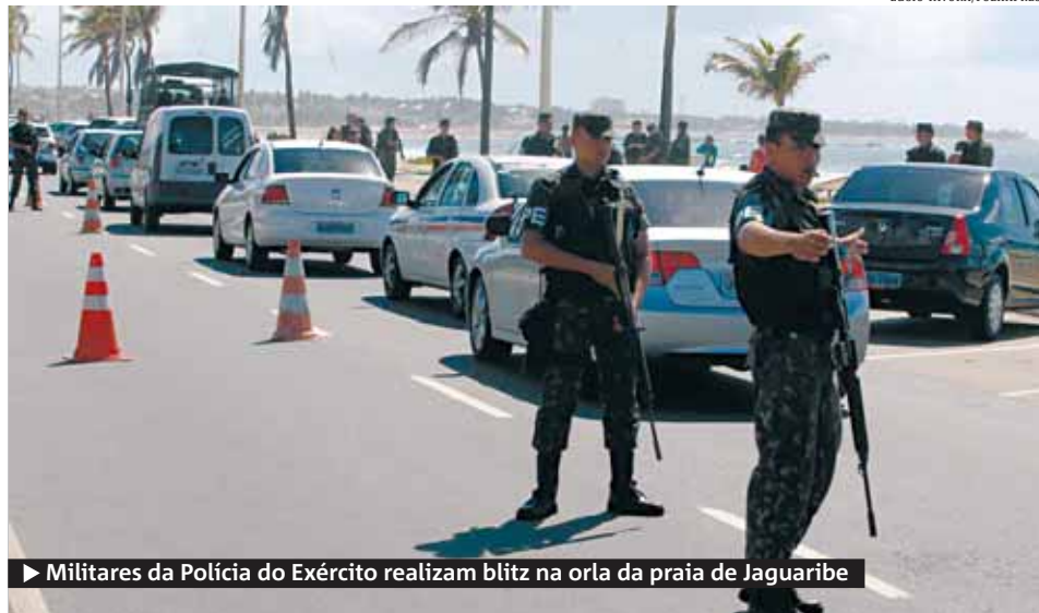
▶ Militares da Polícia do Exército realizam blitz na orla da praia de Jaguaribe

Quarenta homens do COT (Comando de Operações Táticas) da Polícia Federal desembarcaram ontem em Salvador para executar os mandados de prisão expedidos contra inte-