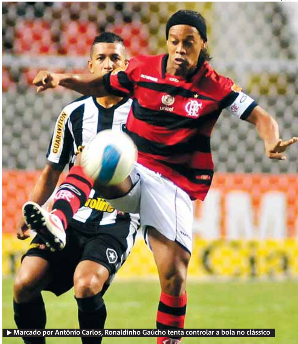
▶ Marcado por Antônio Carlos, Ronaldinho Gaúcho tenta controlar a bola no clássico