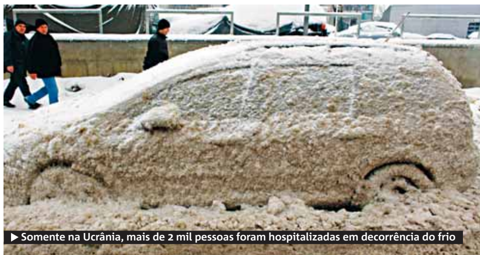
► Somente na Ucrânia, mais de 2 mil pessoas foram hospitalizadas em decorrência do frio