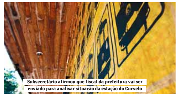
Subsecretário afirmou que fiscal da prefeitura vai ser enviado para analisar situação da estação do Curvelo

Por sua história e constituição, Santa Teresa é um bairro diferente. Por esse motivo é o único da cidade que é, por inteiro, uma Área de Proteção do Ambiente Cultural (Apac). No entanto, nem a proteção é suficiente para preservar a memória dos palacetes e casa assobradadas, que sofrem com o abandono de seus donos ou órgão responsáveis pela manutenção, como é o caso da estação do bondinho do Curvelo e o Palácio São Fernando.