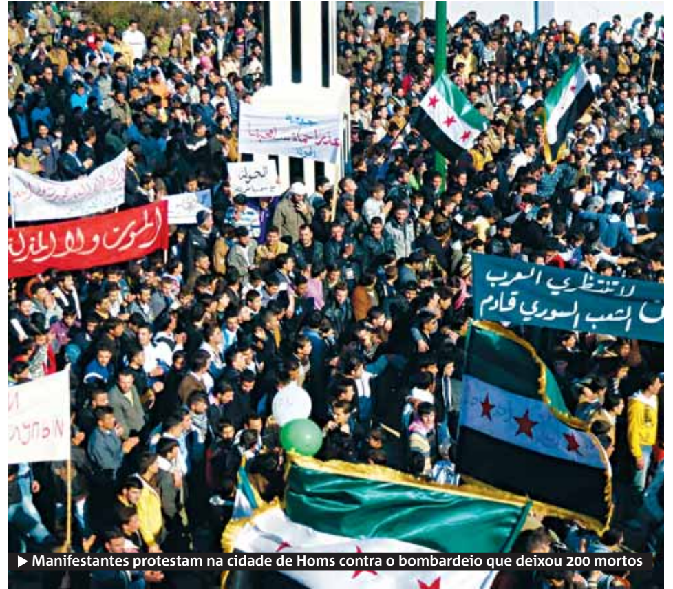
► Manifestantes protestam na cidade de Homs contra o bombardeio que deixou 200 mortos

A votação ocorreu um dia após forças sírias bombardearem a cidade de Homs, matando 200 pessoas, segundo o OSDH. O ataque foi considerado o maior derramamento de sangue entre todas as ondas de revoltas na Síria, que duram 11 meses. O governo negou os atos e se considera vítima da oposição. ● METRO