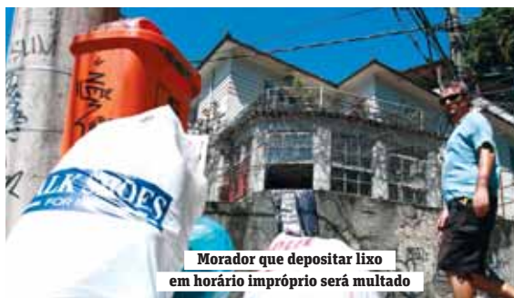
Morador que depositar lixo em horário impróprio será multado

Se há uma década atrás, os moradores de Santa Teresa se orgulhavam de morar em um dos bairros mais limpos da cidade, a realidade de hoje mudou. Um passeio pelas ruas do local mostra que a sujeira tomou conta de diversas ruas, como a Joaquim Murinho (foto acima). Segundo a Associação de Moradores e Amigos de Santa Teresa (Amast), a falta de lixeiras e prateleiras no bairro, combinada com a irregularidade dos horários de coleta da Comlurb são as causas da situação atual.