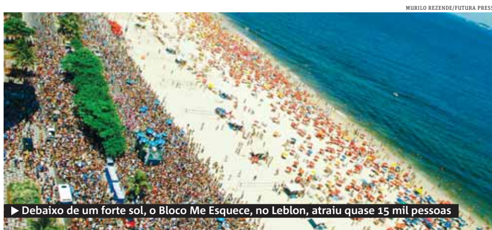
► Debaixo de um forte sol, o Bloco Me Esquece, no Leblon, atraiu quase 15 mil pessoas