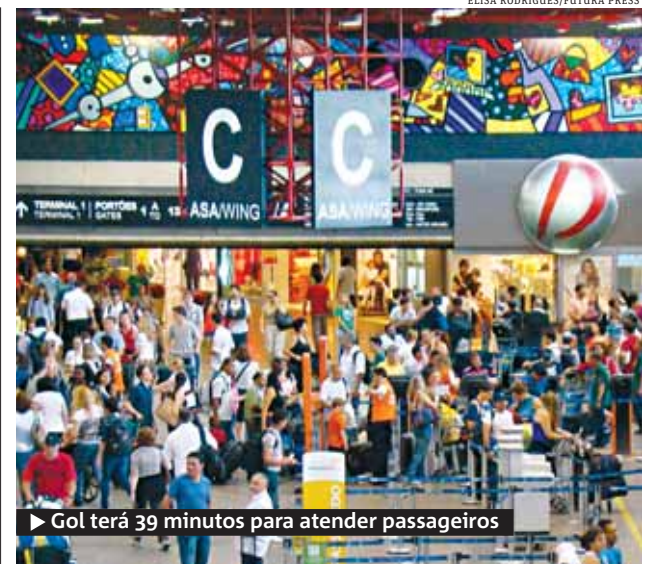
▶ Gol terá 39 minutos para atender passageiros

Apesar do aumento na presença de latinos, os portugueses ainda são o maior grupo, seguidos dos japoneses e italianos. Bolivianos estão em quarto lugar, mas boa parte dos latinos está ilegal e não entra nas estatísticas. ONGs e o governo estimam que haja de 60 mil a 300 mil estrangeiros ilegais no Brasil, a maioria latino-americanos, chineses e africanos, segundo a "Folha de S.Paulo". ●METRO