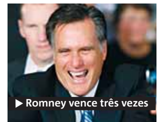
► Romney vence três vezes

na e o Reino Unido aumentou na última semana com a chegada do príncipe William à região. O envio de um submarino nuclear também causou conflitos entre os países. No entanto, autoridades britânicas minimizaram o deslocamento militar ao afirmar que a presença dos navios navais são procedimentos rotineiros. ● METRO