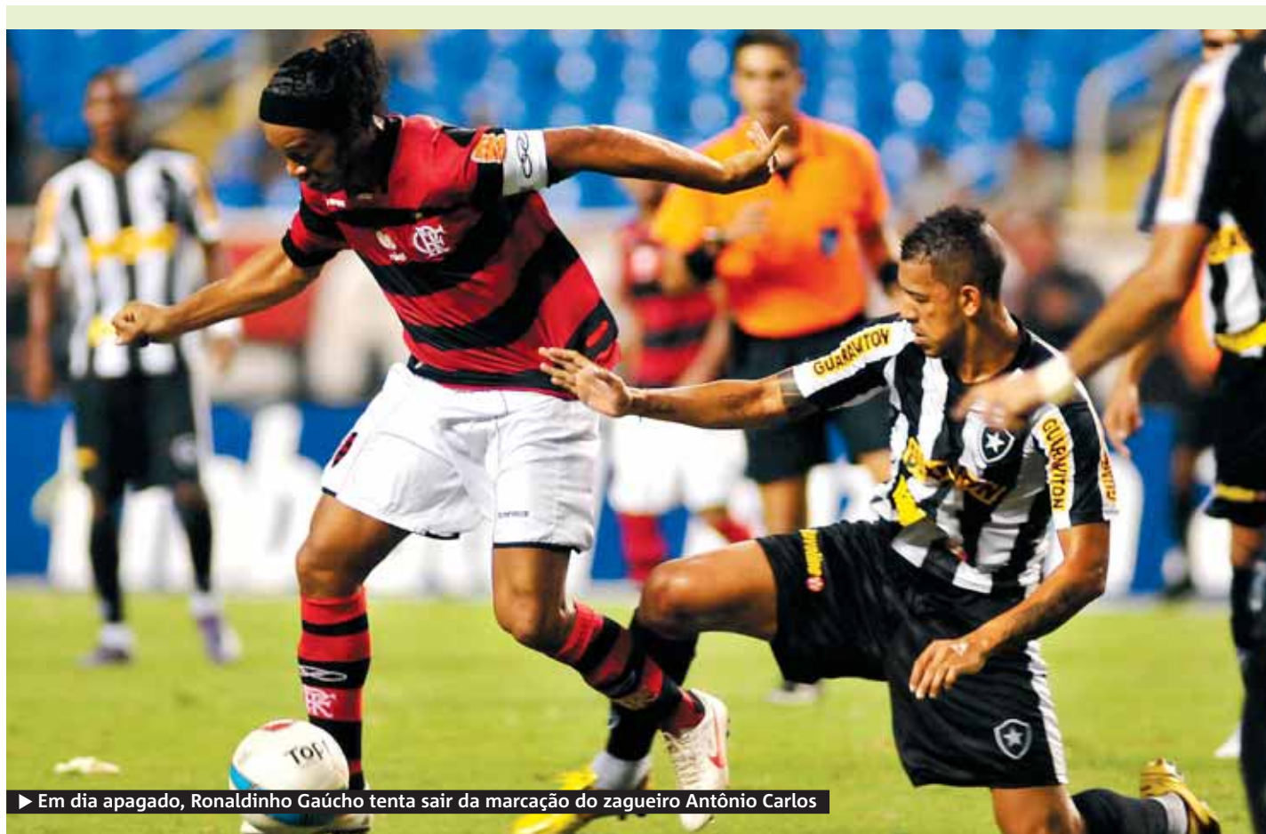
► Em dia apagado, Ronaldinho Gaúcho tenta sair da marcação do zagueiro Antônio Carlos

► Seis meses depois de tragédia que matou cinco pessoas nas ladeiras do bairro, moradores reclamam de conservação de ruas e problemas com o esgoto ► Primeiro edital da reforma do bonde sai até o fim do mês {pág 03}