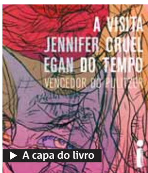
► A capa do livro

Muitos deverão estranhar um capítulo inteiro escrito em formato de planilha de powerpoint. Um capricho que, porém, não rouba a força do romance.