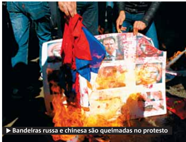
► Bandeiras russa e chinesa são queimadas no protesto

O fracasso diplomático da Onu causou desconforto entre as autoridades norte-americanas e britânicas. A secretária de Estado dos EUA, Hillary Clinton, considerou o veto como uma atitude "grotesca". Já a embaixadora da Onu de Washington, Susan Rice, disse estar "enojada" com o veto e afirmou que "qualquer