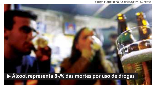
▶ Álcool representa 85% das mortes por uso de drogas

Onze consórcios apresentaram hoje propostas para concessão de três aeroportos. O leilão se refere às melhorias que deverão ser realizadas antes da Copa do Mundo, em 2014, nos terminais de Cumbica e Viracopos e no de Brasília. A operação incluirá a gestão dos terminais até 2031. ●METRO