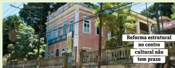
Reforma estrutural no centro cultural não tem prazo