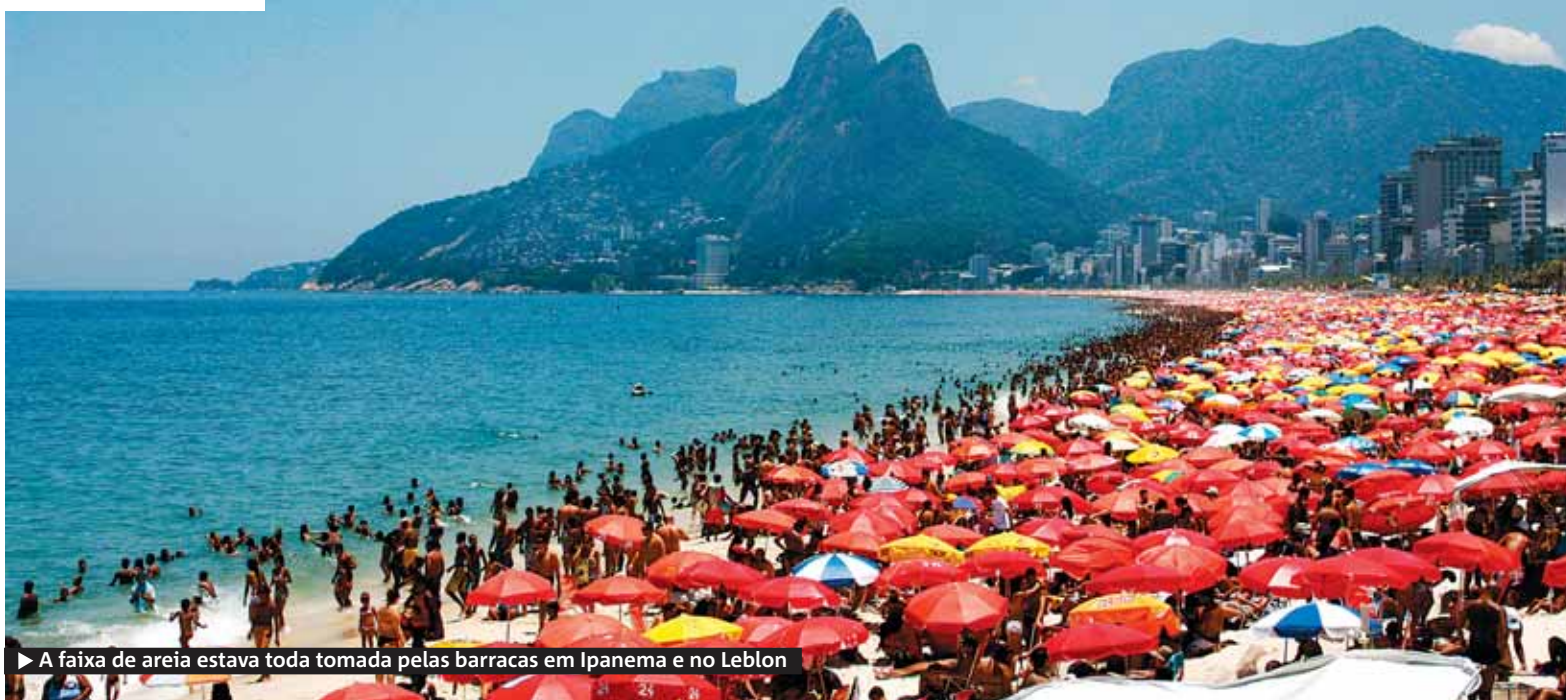
▶ A faixa de areia estava toda tomada pelas barracas em Ipanema e no Leblon