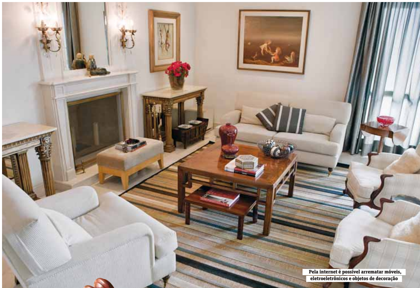
Pela internet é possível arrematar móveis, eletroeletrônicos e objetos de decoração

É possível comprar mobília exposta em apartamentos decorados através de sites de leilões Com alguns cuidados dá pra realizar bons negócios e decorar a casa