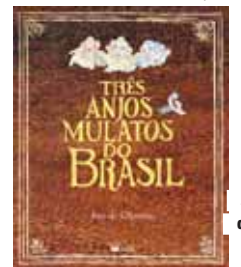
A capa do livro