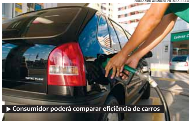
► Consumidor poderá comparar eficiência de carros

Em sua quarta edição, o programa permite ao consumidor comparar o gasto de combustível dos veículos novos à venda no país. Este ano são oito as montadoras participantes (Fiat, Ford, Honda, Kia, Peugeot, Renault, Toyota e Volkswagen), totalizando 157 versões de 105 modelos, que correspondem a 55% do volume de vendas do mercado