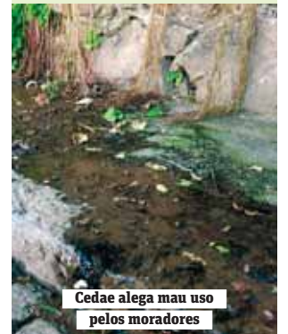
Cedae alega mau uso pelos moradores