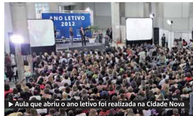
► Aula que abriu o ano letivo foi realizada na Cidade Nova