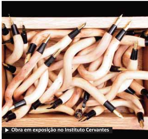
▶ Obra em exposição no Instituto Cervantes

Sala de Exposição no Instituto Cervantes (rua Visconde de Ouro Preto, 62 – Botafogo). De amanhã a 29 de março. De segunda a sexta, das 10h às 19h; sábado, das 10h às 14h. Gratuito.