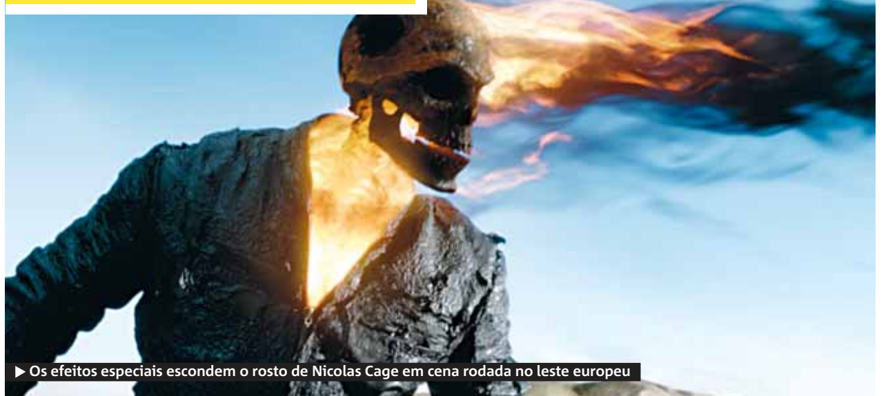
▶ Os efeitos especiais escondem o rosto de Nicolas Cage em cena rodada no leste europeu