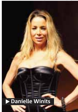
► Danielle Winits