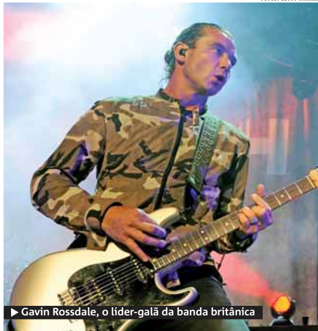
► Gavin Rossdale, o líder-galã da banda britânica