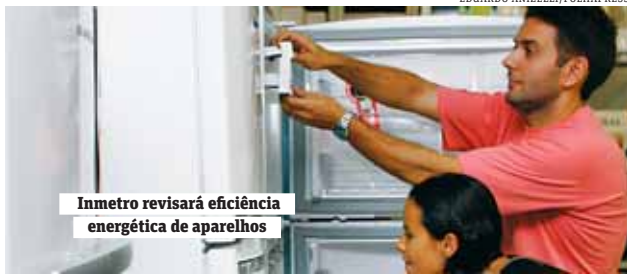
Inmetro revisará eficiência energética de aparelhos