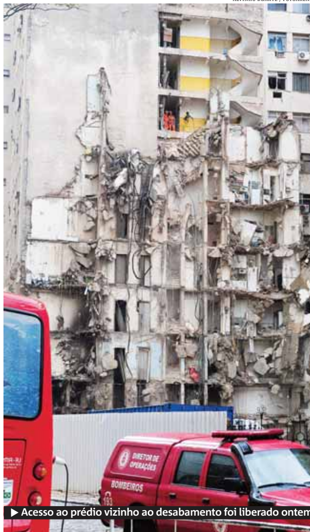
► Acesso ao prédio vizinho ao desabamento foi liberado ontem

Após quatro funcionários da empresa - já demitidos - terem sido flagrados vasculhando objetos entre o entulho, na sexta-feira, a prefeitura determinou que os escombros fossem levados para o depósito da Comlurb, vigiado 24 horas por câmeras e policiais. ● METRO RIO