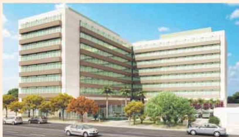
ESTRADA DOS TRÊS RIOS, 1.200 - FREGUESIA