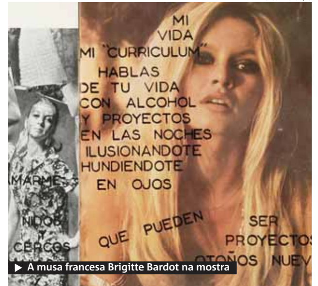
▶ A musa francesa Brigitte Bardot na mostra