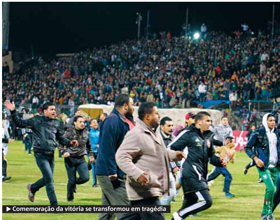
▶ Comemoração da vitória se transformou em tragédia

Promotores egípcios determinaram uma investigação sobre a invasão do campo. ● METRO