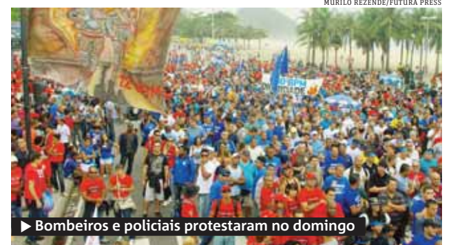
▶ Bombeiros e policiais protestaram no domingo