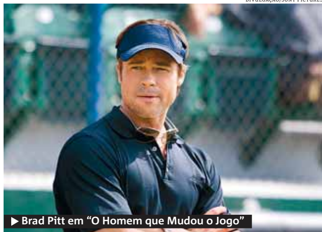
► Brad Pitt em "O Homem que Mudou o Jogo"

de fevereiro é a data da cerimônia de entrega do Oscar, em Los Angeles. O canal a cabo TNT vai transmitir a festa, a partir das 20h30, com apresentação de Sabrina Parlatore e Cássio Reis e comentários de Rubens Ewald Filho.