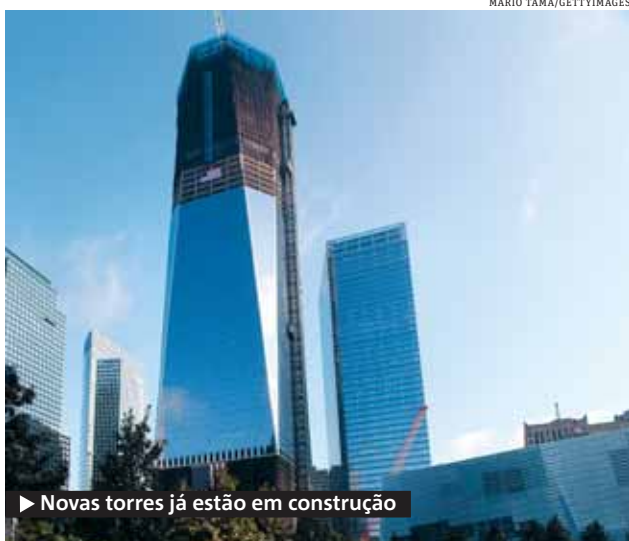
▶ Novas torres já estão em construção