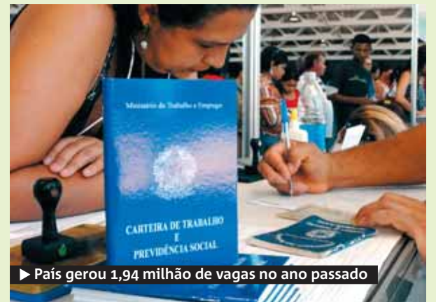
▶ País gerou 1,94 milhão de vagas no ano passado