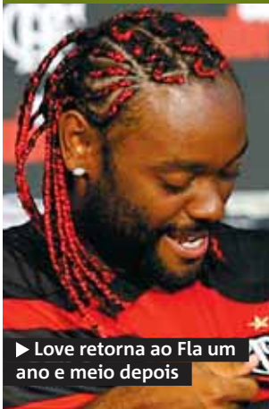
► Love retorna ao Fla um ano e meio depois