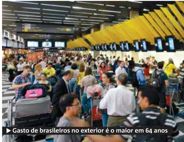
▶ Gasto de brasileiros no exterior é o maior em 64 anos

trangeiros no Brasil atingiram US$ 6,77 bilhões no ano passado e também bateram recorde. Os números representam um crescimento de 14,4% contra o