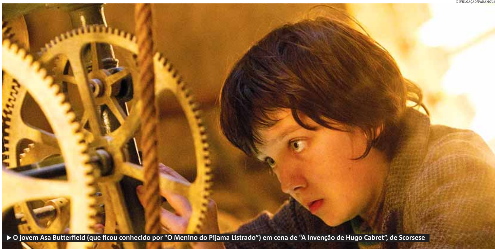
► O jovem Asa Butterfield (que ficou conhecido por "O Menino do Pijama Listrado") em cena de "A Invenção de Hugo Cabret", de Scorsese

Procurar a justiça no Oscar é o mesmo que tentar encontrá-la em uma partida de futebol. Ontem, ao anunciar os indicados ao Oscar 2012, a Academia de Hollywood, como sempre, surpreendeu positiva e negativamente. Na categoria Melhor Ator, selecionou George Clooney ("Os Descendentes"), "Brad Pitt" ("O Homem que Mudou o Jogo"), Gary Oldman ("O Es-