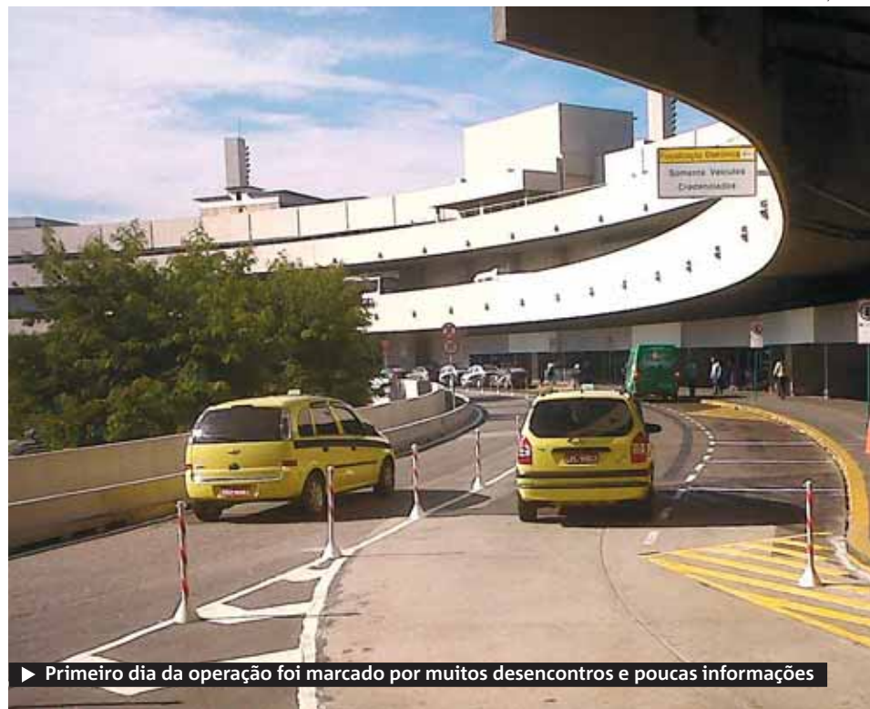
▶ Primeiro dia da operação foi marcado por muitos desencontros e poucas informações

Qualquer outro veículo não autorizado a circular pelo Galeão terá de deixar ou buscar seus passageiros pelo setor de embarque. Caso tente entrar no terminal de desembarque, será multado, pois o veículo não será reconhecido pelo sistema eletrônico. ● METRO RIO