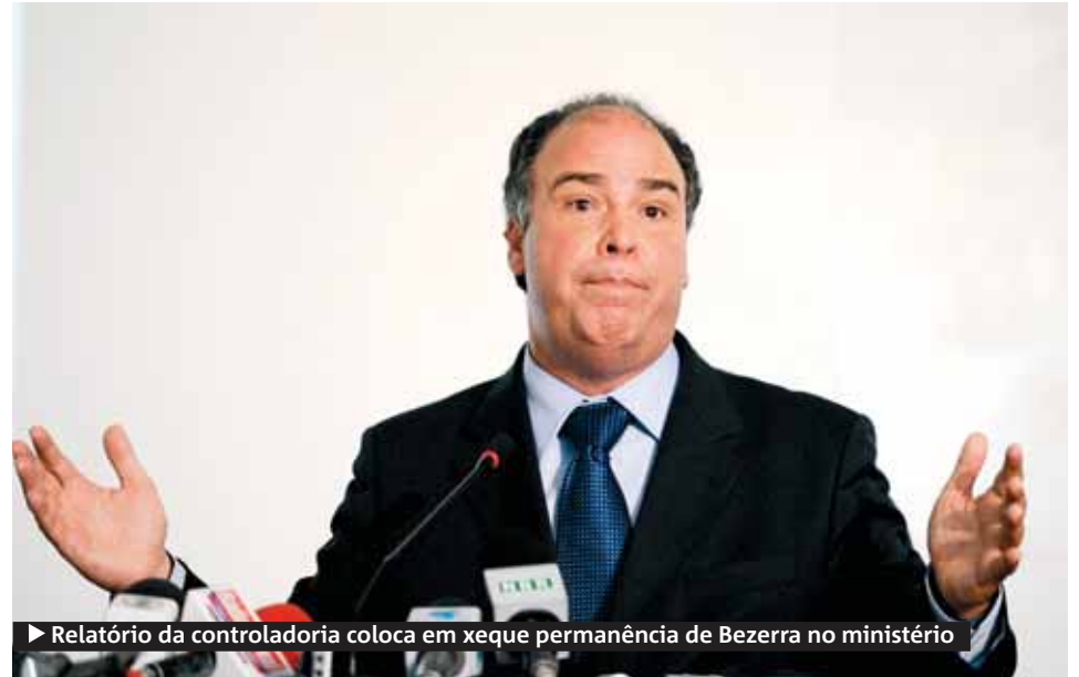
► Relatório da controladoria coloca em xeque permanência de Bezerra no ministério