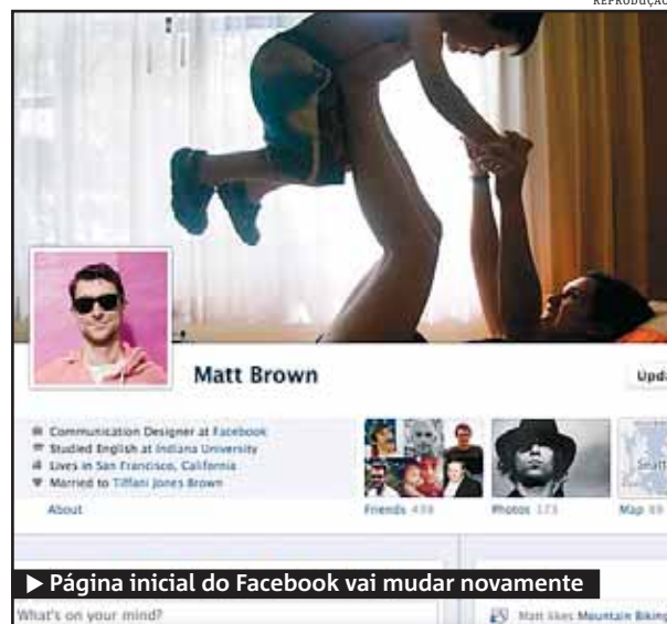
Página inicial do Facebook vai mudar novamente