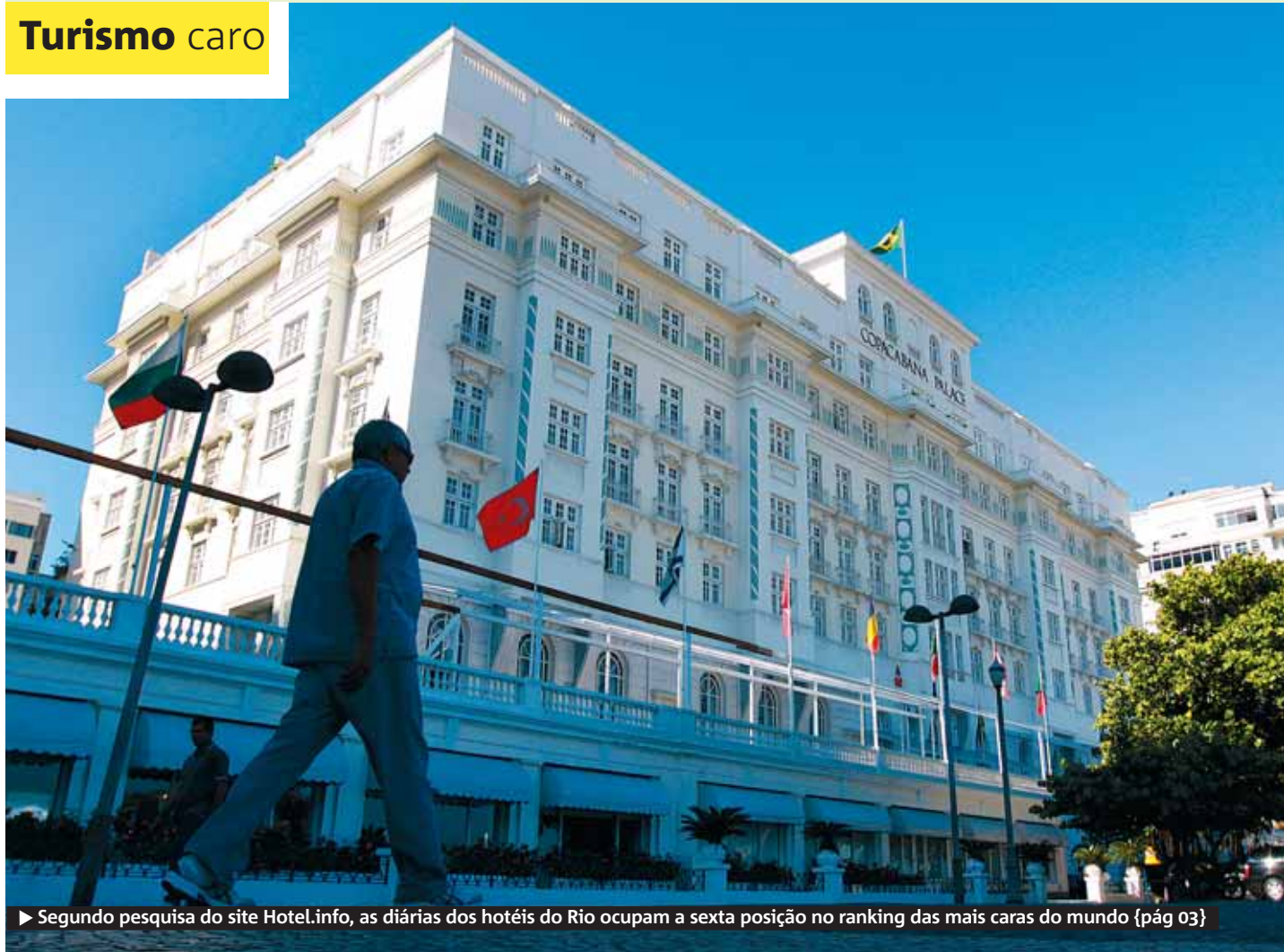
► Segundo pesquisa do site Hotel.info, as diárias dos hotéis do Rio ocupam a sexta posição no ranking das mais caras do mundo {pág 03}