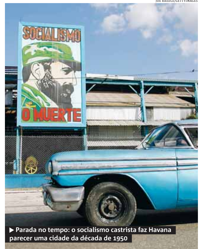
▶ Parada no tempo: o socialismo castrista faz Havana parecer uma cidade da década de 1950