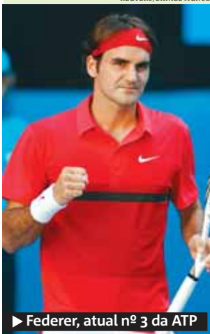
► Federer, atual nº 3 da ATP